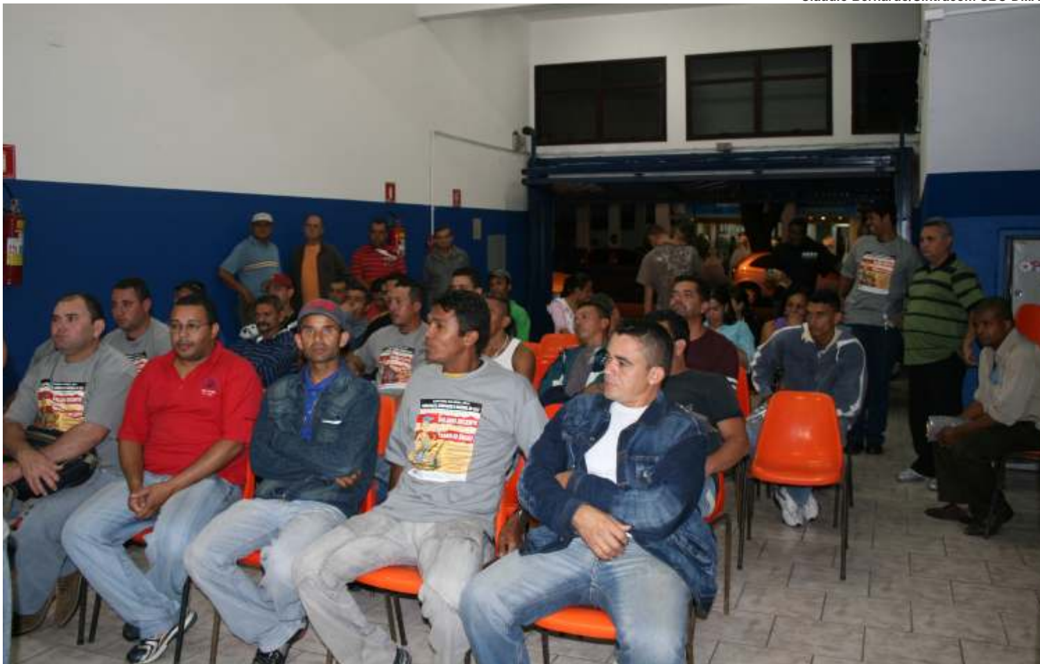
Pág 3 Assembléia em 5 de março aprovou reivindicações para capanha que terá Trabalho Decente como tema

Embora as entidades preparadas, fazendo todo esforço, isso não é suficiente se você, trabalhador, não entender que também precisa fazer sua parte.