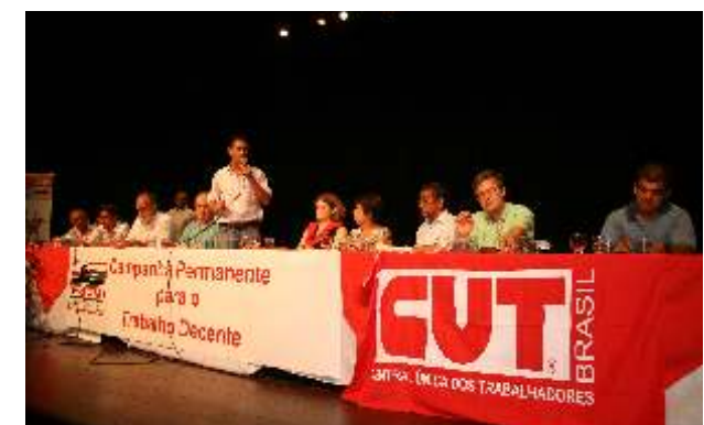
Mesa reuniu representantes de vários setores