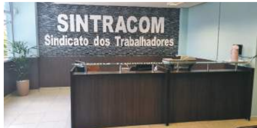
RECEPÇÃO COM NOVO VISUAL